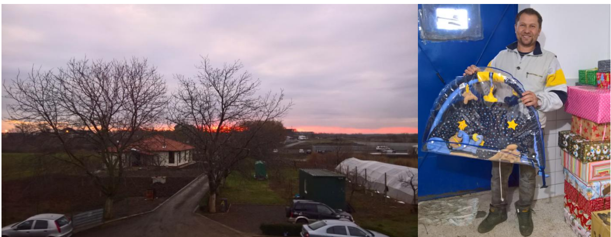
Unten rechts unser Rudi V., der Etliches für seine große Familie in der Siedlung C. gebrauchen konnte.